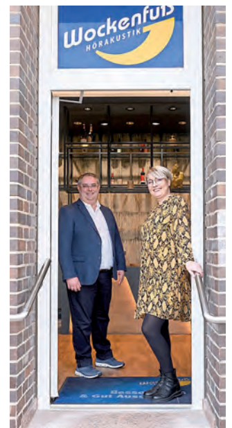
Brunel University, London. Online: https://www.ehima.com/documents/