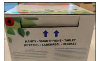
Sammelbox - aufgestellt in der Pfarrscheune Lichtenhagen Dorf

und der Rechte von Arbeitenden in den Minen abgebaut werden. Nur durchschnittlich eineinhalb Jahre wird ein Handy genutzt bis es durch ein neues Gerät ersetzt wird. Recycling bleibt die Ausnahme. Wir weisen mit anderen Organisationen z. B. Brot für die Welt und dem Naturschutzbund NABU darauf hin, dass dies nicht so bleiben muss. Deshalb steht bis Ostern im Foyer der Pfarrscheune eine Sammelbox und wir ermöglichen, dass Ihr altes Handy, Smartphone, Tablet, Netzteil, Ladekabel, Headset recycelt wird. Damit wollen wir einen Beitrag zu mehr globaler Gerechtigkeit leisten und untereinander das Bewusstsein auf „Kreislauf statt Einbahnstraße“ wecken.