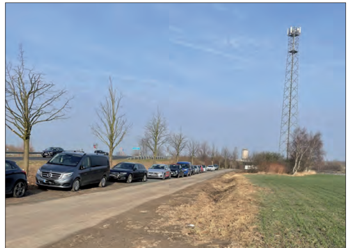
PKW-Stellfläche an der Autobahnauffahrt A 20 Südstadt